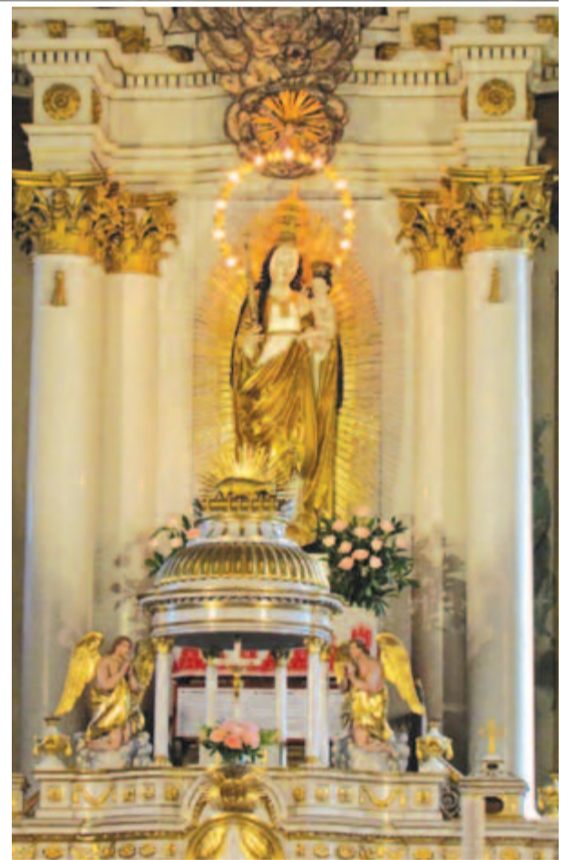
A csíksomlyói Mária-szobor

A templom közelében még a 19. század elején gyógyhatású kénforrást fedeztek fel. A dominikánusok kórházat is építettek ide. A