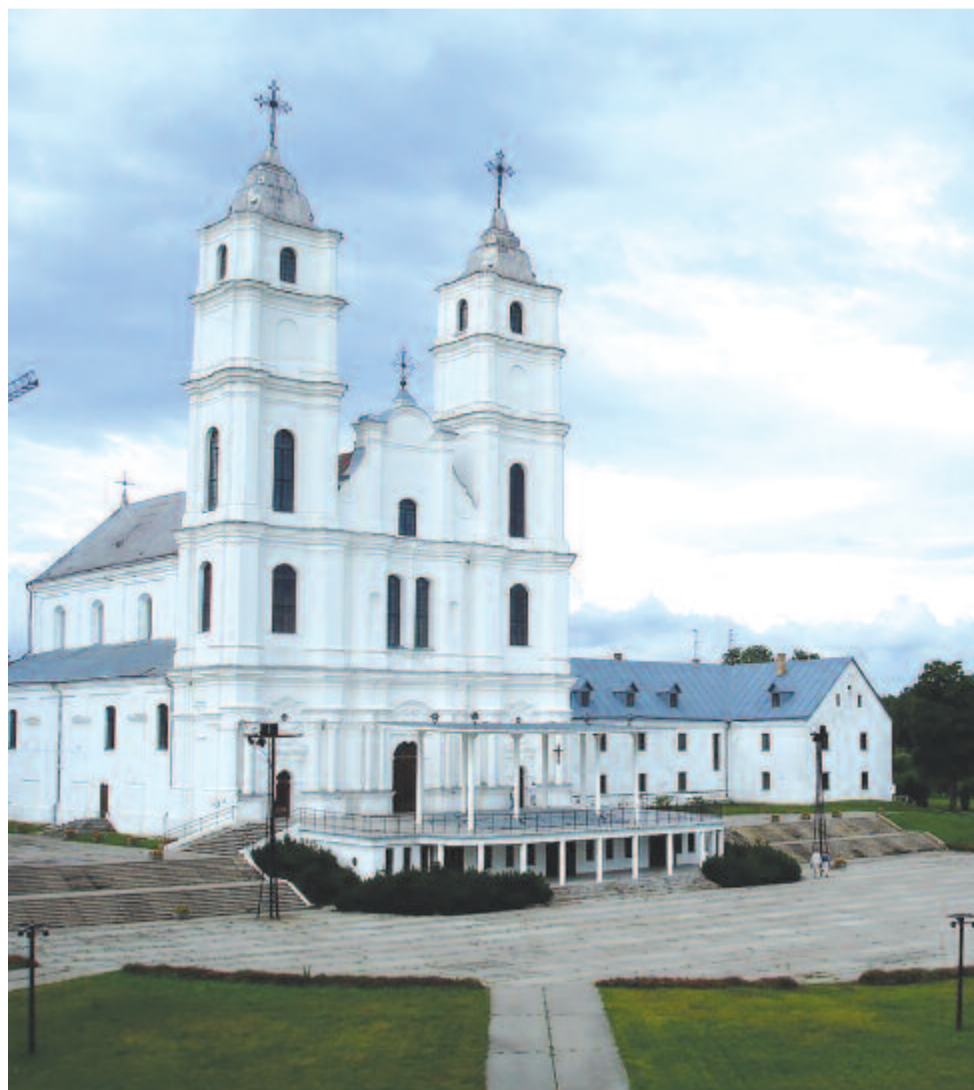
Az aglonai bazilika

Az egymástól másfél ezer kilométernyire fekvő csíksomlyói és aglonai búcsú üzenete évszázadok óta ugyanaz: őrizzük meg hitünket, közösségünket, együvé tartozásunkat szeretetben.