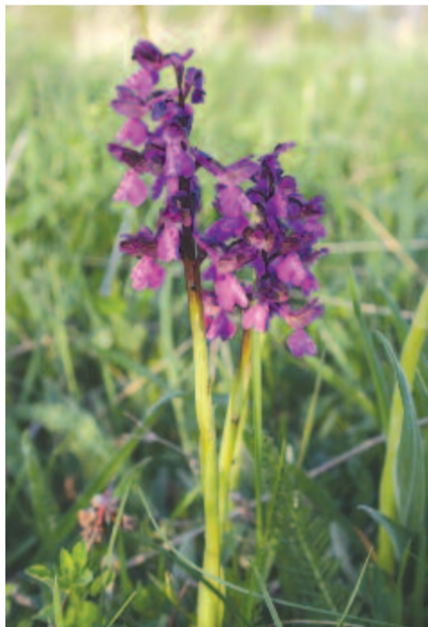
Agárkosbor bókola a nyárnak Nagyenyed határában

mert hogyha meghalok, ezerszer élek én, és szép a sorsom, és szép, ezerszer szép az én koporsóm.