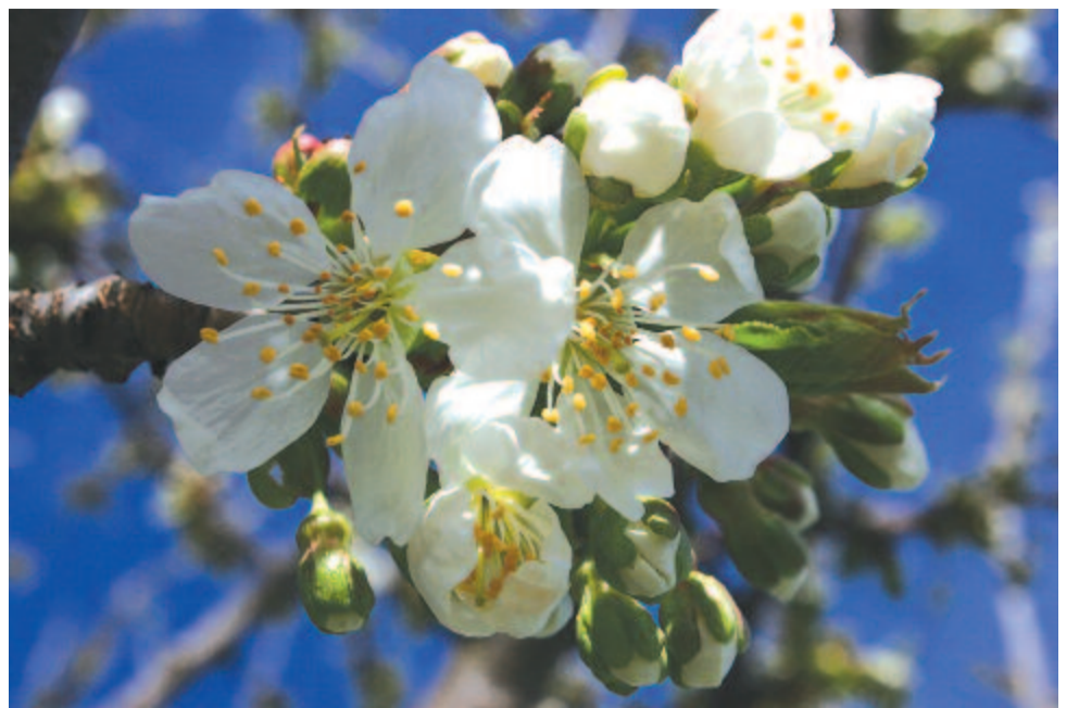
Lángfehér virágú szép cseresznye szíromhulltába tartom a fejem

meglett korúak (maiores) tiszteletére nevezték volna el – írja Jankovics Marcell Jelkép-kalendáriumában. – Valószínűbb azonban, hogy a régi római termékenység-istennő, Maia vagy férfi párja, Maius volt a névadó. A görögöknél Maia a pleiászok egyik csillaga volt, Zeusz szeretője, és a főistennel együtt töltött éjszakák eredményeként Hermész (a latin Mercurius) anyja. Ez a planétaistenfi az asztrológia májusi Ikrek jegyében van „otthon”. (...) a 7 pleiázt, a Pleiades 7 csillagát a görögök – de mások is – kapcsolatba hozták a 7 planétával. (...) csillagzat szabad szemmel látható csillagainak a száma megegyezik a szabad szemmel látható planétákéval. (...) A csillagkép olümposzi védnöke ugyanakkor Apollón volt. Ők hárman egy vidám regében együtt is szerepelnek. Ez az isteni tolvaj Hermész első csínytevéséről szól, aki még azon a napon, hogy megszületett, ellopta bácsikájának, Apollónnak 50 marháját – a hónap első kétharmadában még a Bika havában járunk –, aztán, mint aki jól végezte dolgát, visszabújt a pólyába, Maia ölébe. A görög maia „anyácskát”, „dajkát”, „bábát”, a dór nyelvújításban „nagyanyát” jelentett (...) Maia a növekedés és a szaporulat felett bábáskodott, s a május valóban a növekedés hónapja. Bizonyos értelemben Ovidius fején találta a szöveget, hisz maior, maius a latin magnus, „nagy” melléknév közép- és felsőfoka, és a növekedést fejezi ki.