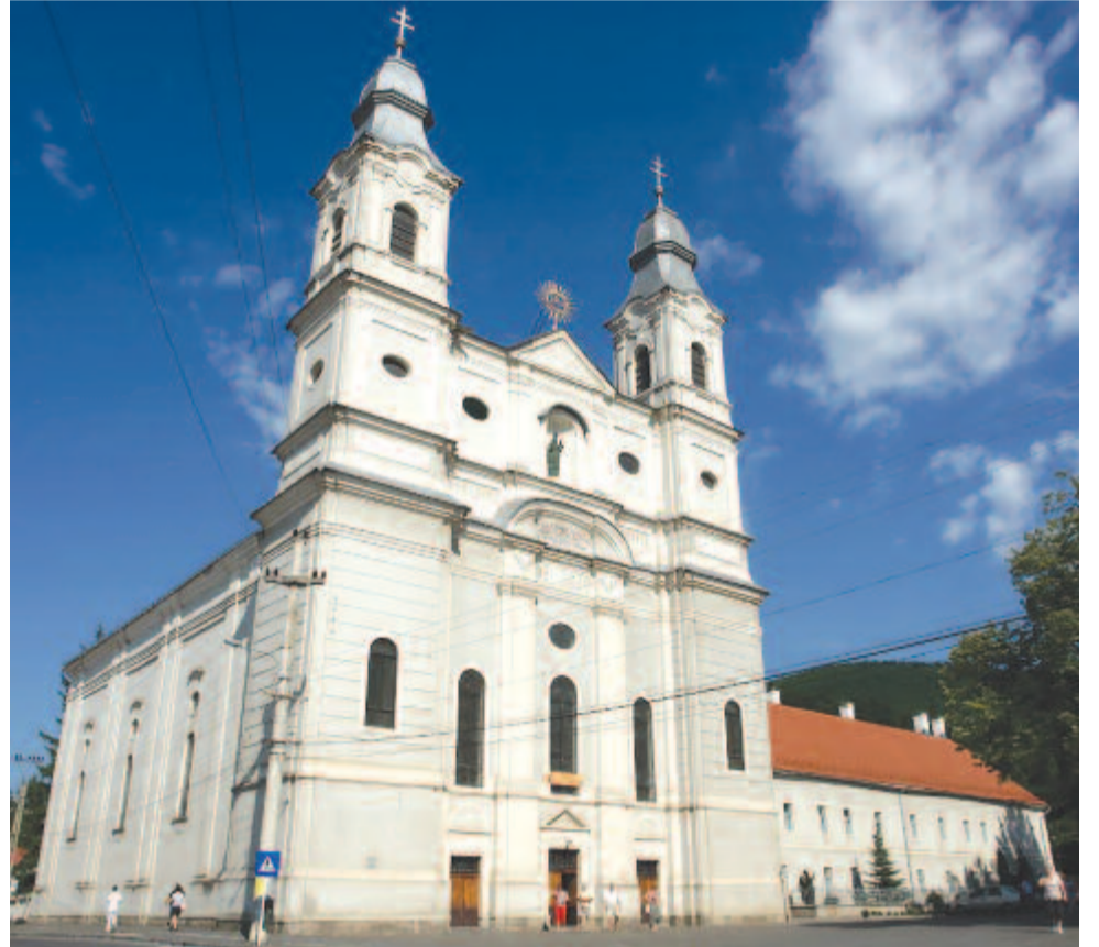
A csíksomlyói kegytemplom

A Domonkos-rend szerzetesei a 16. században fatemplomot építettek két nagyobb tő között, erdővel borított területen, amiben elhelyezték a Vilniusból vitt Mária-ikont. Elkezdődtek a zarándoklatok Aglonába. Az 1700-as évek közepén szükségessé vált egy kőtemplom és kolostor építése. 1768-ban kezdték el a késő barokk stílusban építeni a bazilikát, és 1800-ban fejezték be. Két 60 méter magas torony díszíti. A Mennybemenetel-ba-